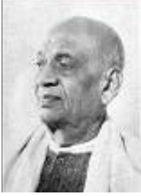
సర్దార్ వల్లభాయి పటేల్