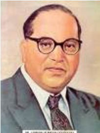
డాక్టర్ బీ.ఆర్. అంబేద్కర్