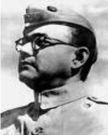
సుభాష్ చంద్ర బోస్