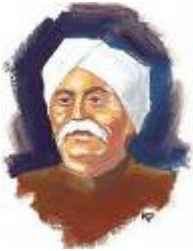
లాలా లజపతి రాయ్