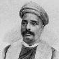
బాల గంగాధర తిలక్