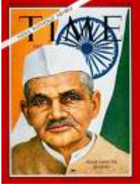
లాల్ బహదూర్ శాస్త్రి

లాల్ బహదూర్ శాస్త్రి, లాలా లజపతి రాయ్, డాక్టర్ బీ.ఆర్. అంబేద్కర్, రాజాజీ, రాజీవ్ గాంధీ, ఇందిరా గాంధీ, మహాత్మా గాంధీ, భగత్ సింగ్, పీ.వీ.నరసింహ రావు, సర్దార్ వల్లభాయి పటేల్, బాల గంగాధర తిలక్, సుభాష్ చంద్ర బోస్